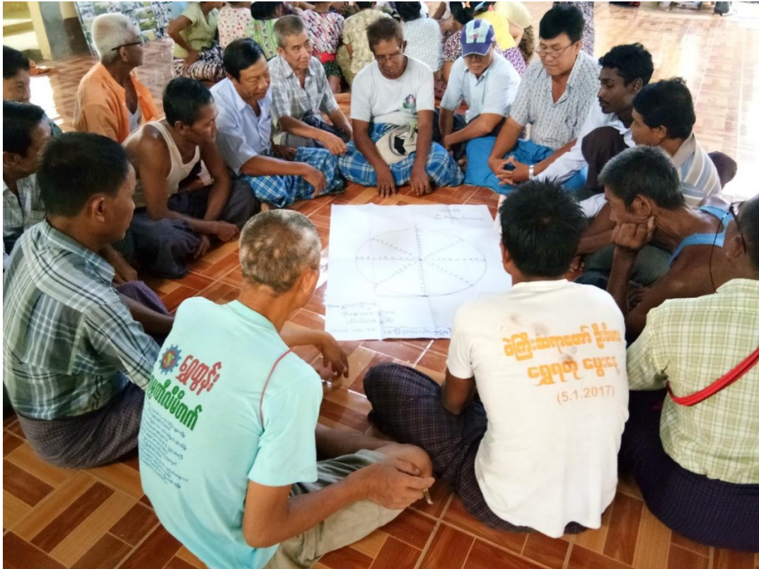
လူမှုဆန်းစစ်ခြင်းပြုလုပ်နေခြင်း မှတ်တမ်းဓာတ်ပုံ