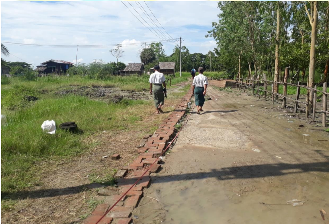
စီမံကိန်းလုပ်ငန်းခွဲ မစတင်မီ မှတ်တမ်းဓာတ်ပုံ