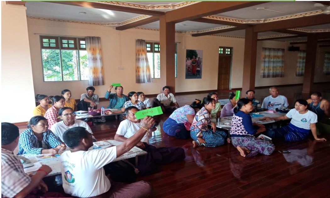
ကော်မတီများ စီမံခန့်ခွဲမှု သင်တန်း ဓာတ်ပုံ