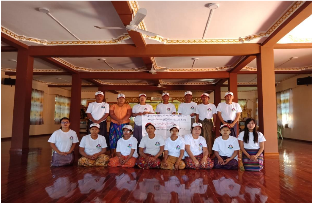
ကော်မတီဝင်များ မှတ်တမ်းတင်ဓာတ်ပုံ